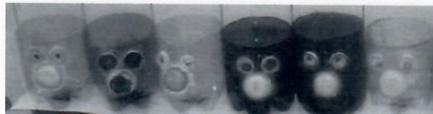
inspirativní ukázka 1

Můžete využít i prázdnou plastovou lahev, kterou seříznete, ozdobíte např. plastovými víčky, nebo polepíte...a máte hned veselou nádobku k sázení ;-)