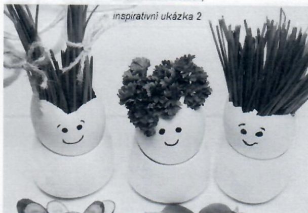
inspirativní ukázka 2